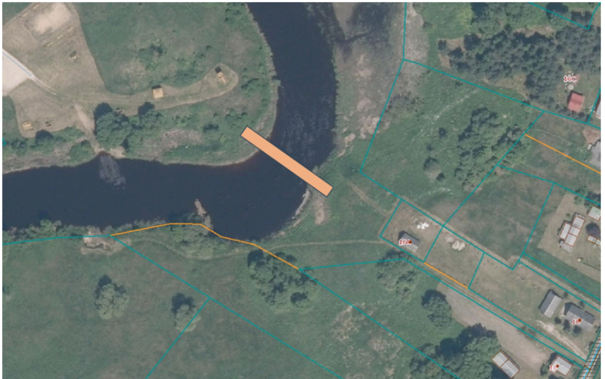
2 pav. Pėsčiųjų tilto preliminari vieta su prieigomis